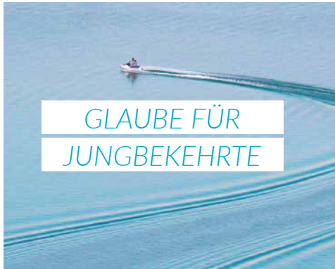
Woran erkennt man die Leitung durch den Heiligen Geist? 4