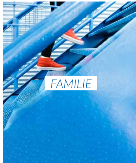
Eltern helfen, in deren Leben Dinge falsch sind 16