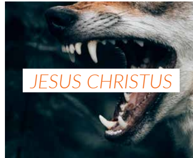
Ein Lamm von wilden Tieren umzingelt 10