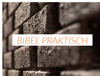
Die Menschen von Babel 24