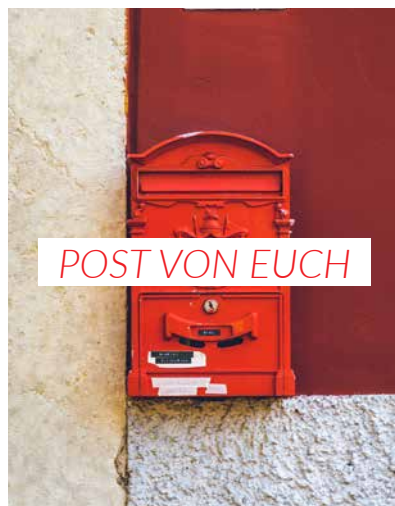
Lästerliches über den Heiligen Geist sagen 20