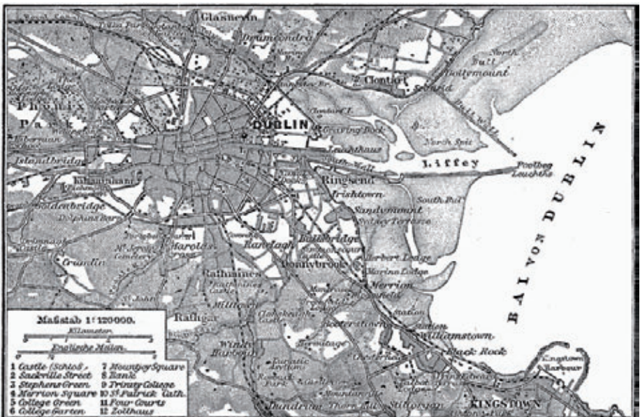
Dublin: Historische Karte (um 1888)