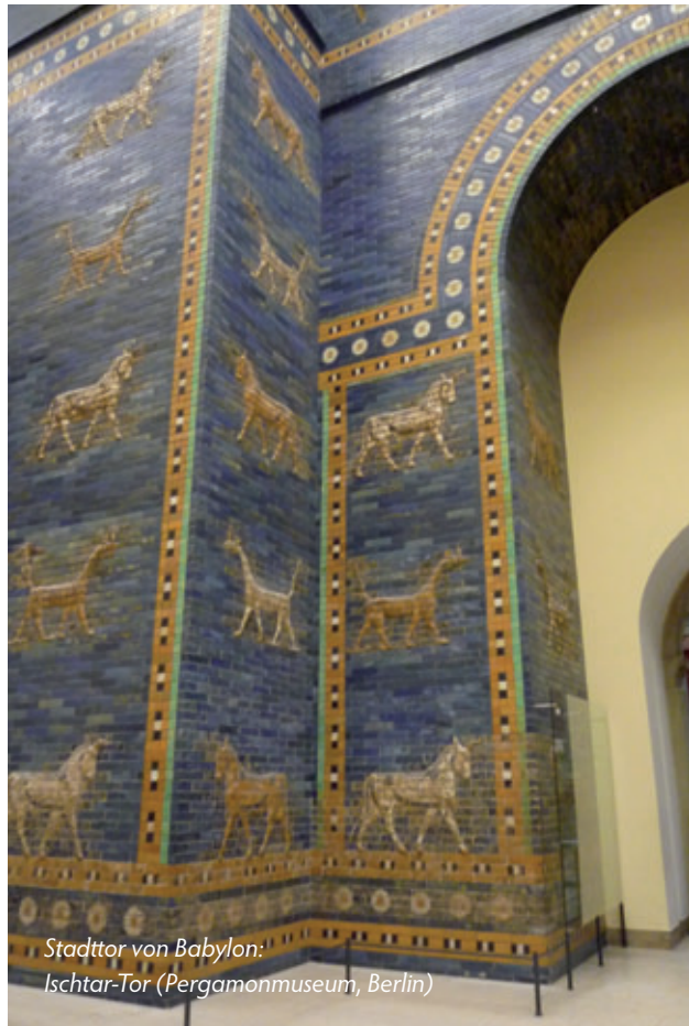
Stadtter von Babylon: Ishtar-Tor (Pergamonmuseum, Berlin)

Tiefe: Die Neider sorgen dafür, dass Darius ein anmaßendes Edikt erlässt: