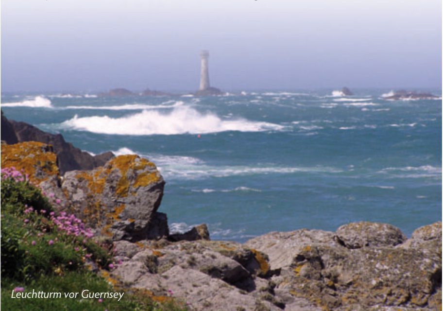
Leuchtturm vor Guernsey