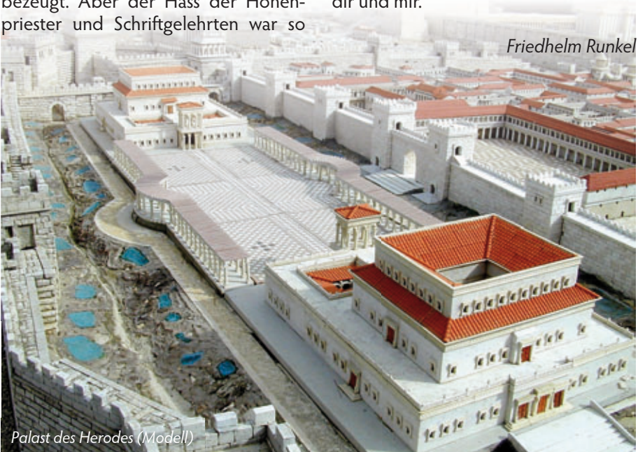
Palast des Herodes (Modell)